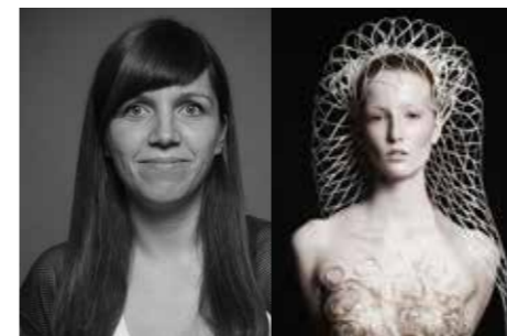
AVANTGARDE NADIN SCHNEIDERREIT

Aproposhaar, Hirschberg