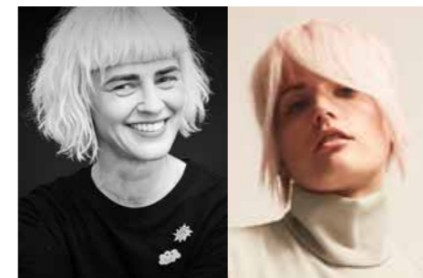
PRESSE JANA PÄTZOLD

Haarmonie & Beauty, Berlin