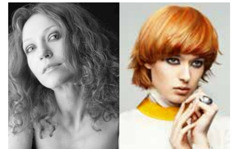
DAMEN SÜD ADRIANA PUCH

D. Machts Group, Berlin